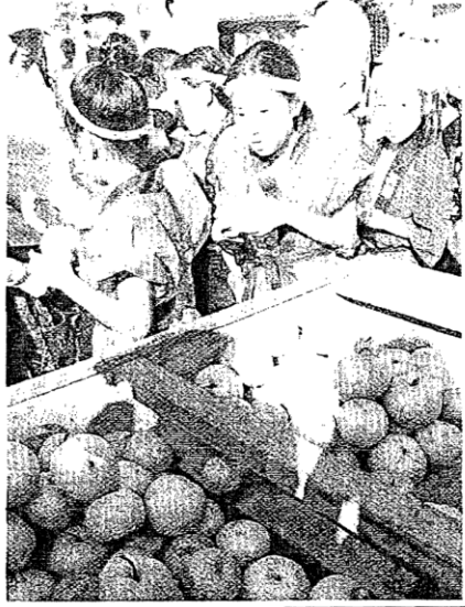
多摩区から運んだ長十郎梨を無料配布する児童ら。川崎区の大師河原村

川崎市川崎区の区の木「長十郎梨」を大八車に積み込み、発祥の地とされる川崎区内をパレードする「長十郎梨の里帰り」を実施。川崎区制40周年記念の事業に位置付けられ、長十郎梨まつりとして盛り上げた。この日、里帰りの梨は300個。午前中にJR川崎駅周辺を巡回した大八車は、午後には大師地区に移動。川崎大師駅の特設ステージでは、東大島と川中島の2市立小学校の児童らが長十郎梨の由来や歴史など、授業で学んできた成果を発表した。