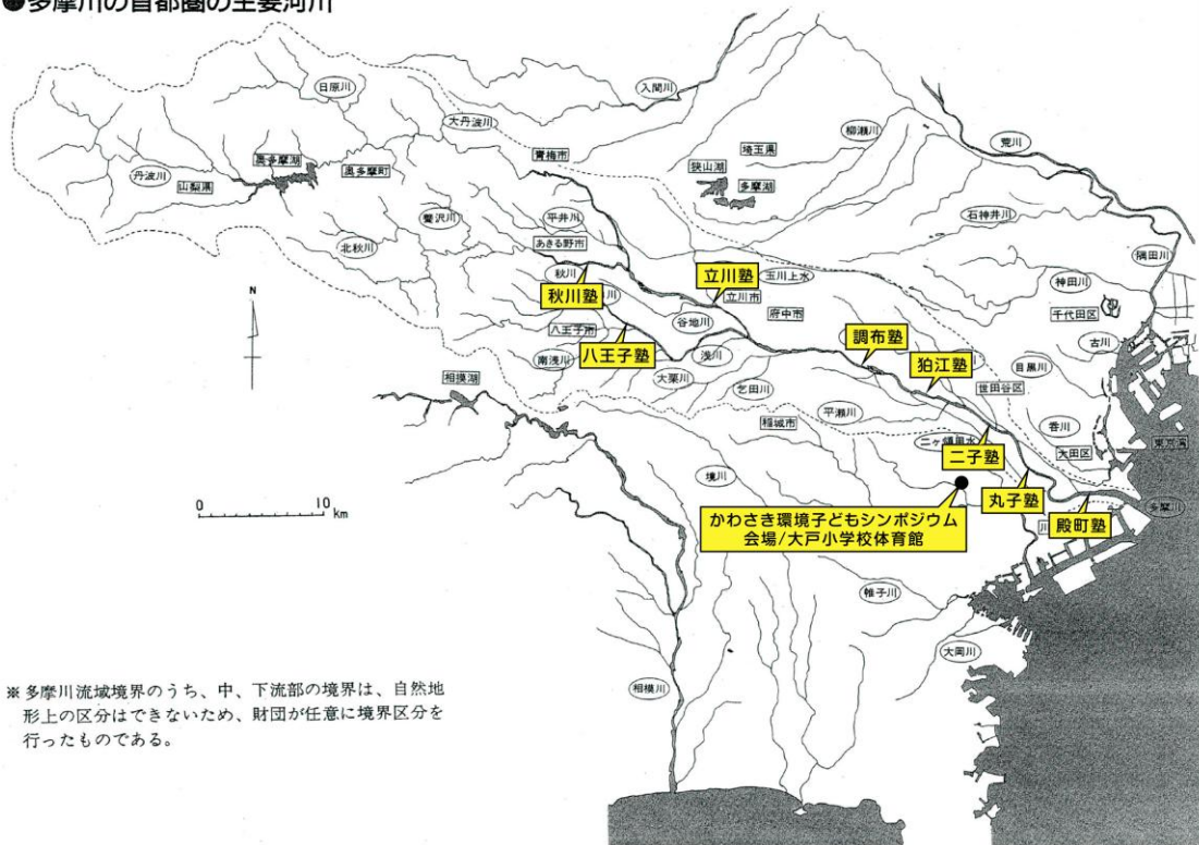
●多摩川の首都圏の主要河川