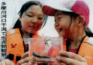
多摩川河口干潟で生き物観察