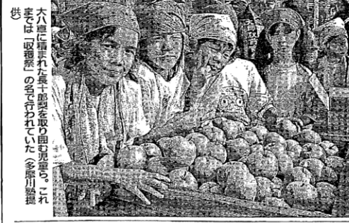
大八車に積み込まれた長十郎梨を盛り出す児童ら。これは「収穫祭」の一環で行われていた（多摩川産地）

多摩区で収穫 大八車でパレード 17日に川崎区へ まつりは午前10時、JR川崎駅周辺で行われるPRパレードでスタート。ラ・チャテララの中央噴水広場から銀柳街、川崎銀座街まで、長十郎梨を積み込んだ大八車を中心に行進する。午後2時からは、川崎島神社・川崎大師駅をパレード。長十郎梨について学習してきた市立東大島、市立川中島の両小学校4年生計約90人が、オリジナル曲「長十郎梨の里帰り」と「梨おどり」を披露しながら盛り歩く。