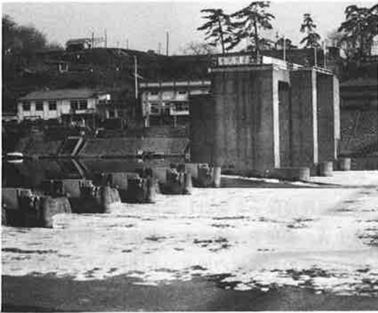
調布堰と洗剤の泡 (左にある建物は水道のポンプ場、1970年1月撮影)

中学校までを郷里の武生市で、高等学校を金沢市で過した私にとって、東京については、写真で見たり新聞、本などの文字を通じて知りうる程度の認識しかなかった。TVが映像を全国のどんな田舎にも時々刻々と送り出している現在とは比較にならない情報過少の時代であったからである。首都である東京についてさえ、その程度の認識であったから、多摩川が存在などは名前すら知らなかったのである。