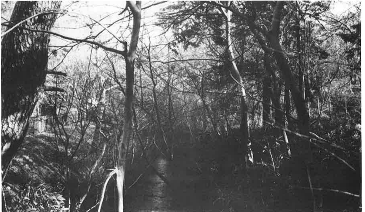
春浅い玉川上水（三鷹市井の頭5丁目目）