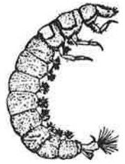
清流にすむウルマーシマトビケラ